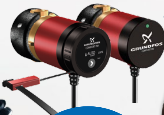
COMFORT PM/PM AUTOADAPT

Hidraulikus beüzemelés egyszerűen, gyorsan